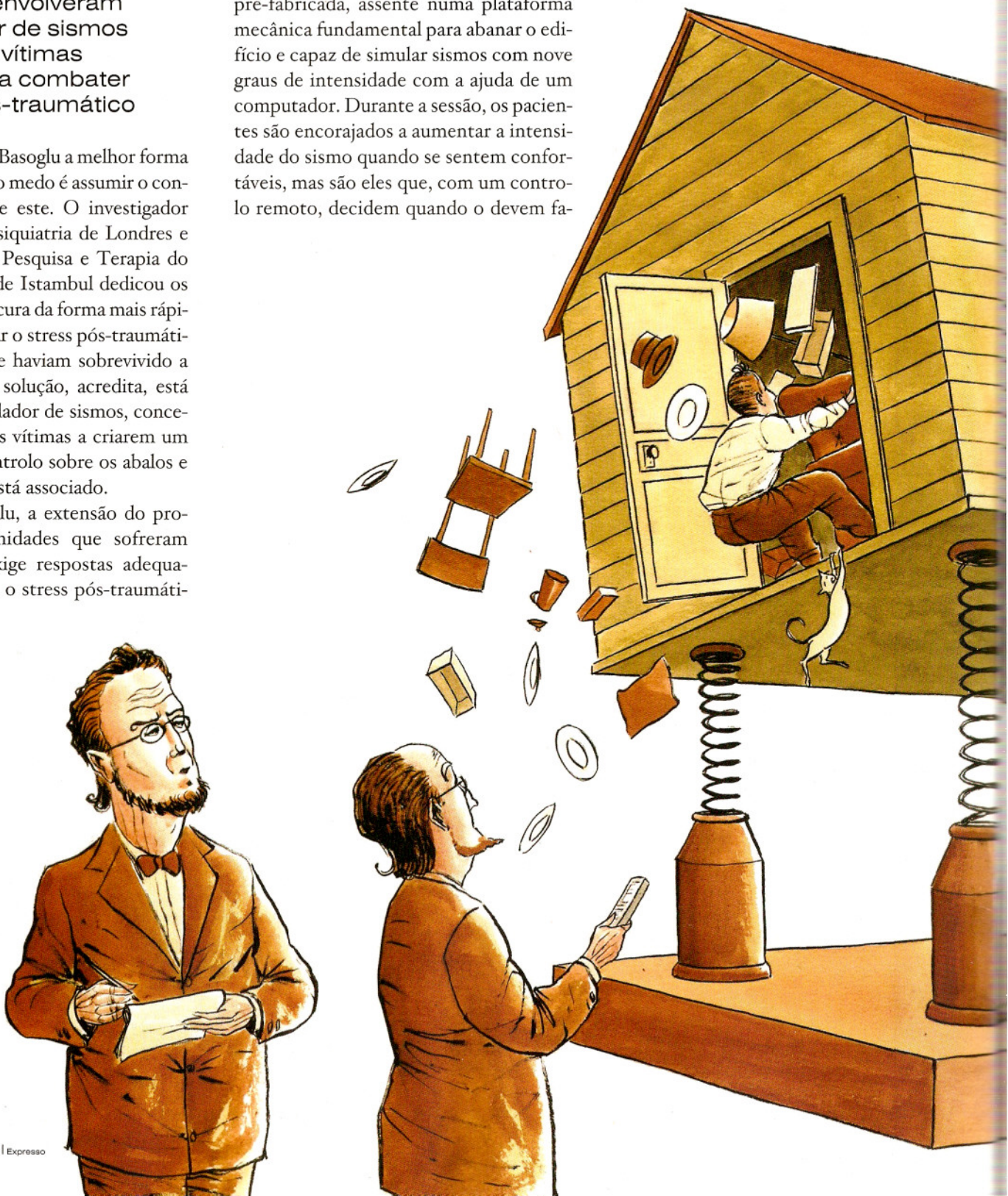
ILUSTRAÇÃO DE JOSÉ CARLOS FERNANDES

Os resultados são animadores. Oito dos 10 sobreviventes do terramoto de 1999 que se submeteram à terapia num primeiro estudo revelaram uma redução significativa dos sintomas de stress